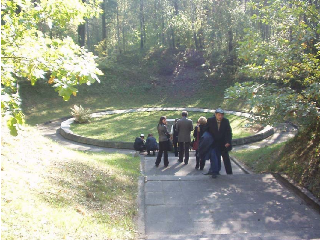
Blumen-Niederlegung für ermordete Angehörige an einer der Gruben in Ponar

Das Protokoll für diese Staatstrauer obliegt dem litauischen Präsidialamt – das bringt grundlegende Veränderungen für die Trauer- und Gedenkprozesse innerhalb der jüdischen Gemeinde und bei den Überlebenden mit sich. Die Trauer um die Angehörigen und Freunde, um die untergegangene Lebenswelt, die zu Sowjetzeiten nur inoffiziell stattfand, darf nun zwar offen gezeigt werden, aber sie ist auch in einen politischen Rahmen eingebunden und ist denen, die tatsächlich trauern, für die die Trauer um die ermordeten Juden Litauens eine „Nahemotion“ 42 und nicht nur „Gedenken“ ist, aus den Händen genommen.