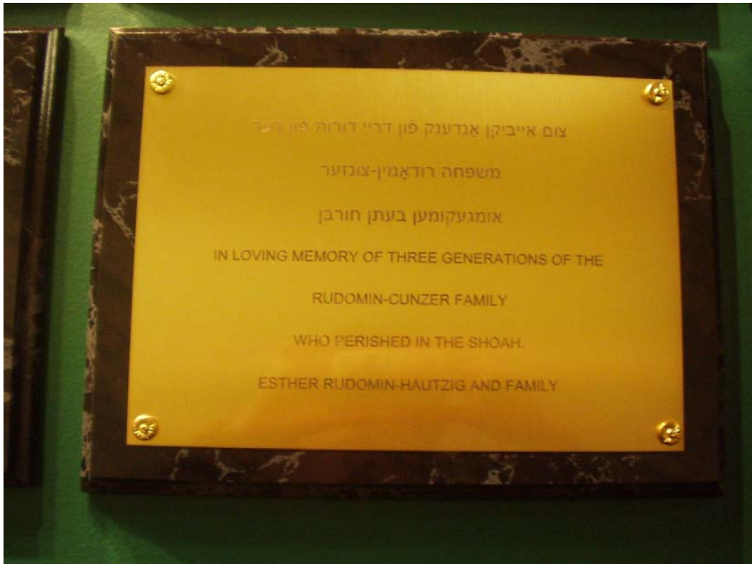
Gedenktafeln für die im Holocaust ermordeten Angehörigen und Freunde einzelner NV Mitglieder 27