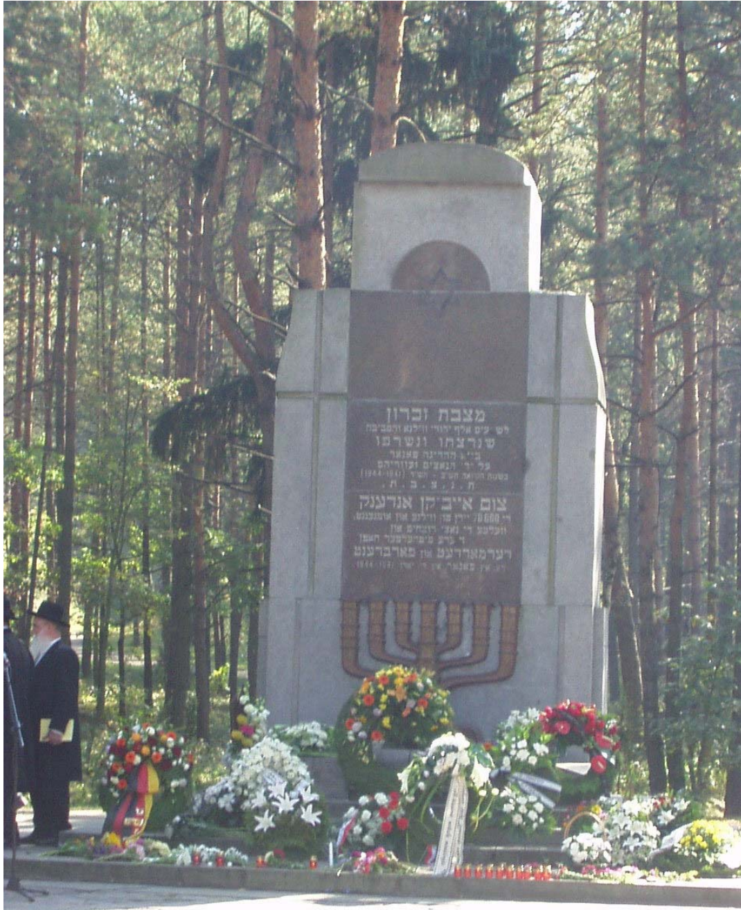
Holocaust-Mahnmal in Ponar, Nationaler Holocaust Gedenntag, 23.9.2003