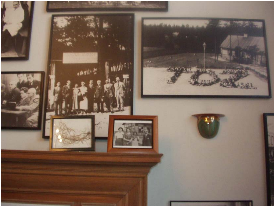
Getrocknetes Gras aus Ponar (linkes Bild vorne) im Salon einer ehemaligen Wilnaerin, Sommer 2002, New York; im Hintergrund historische Aufnahmen aus dem jüdischen Wilna der Zwischenkriegszeit.

Mehrere meiner New Yorker Gesprächspartner haben getrocknete Blätter und Blumen aus Ponar mitgebracht, die unter Glas gerahmt im Schlafzimmer oder in den Wohnräumen ihren Platz gefunden haben.