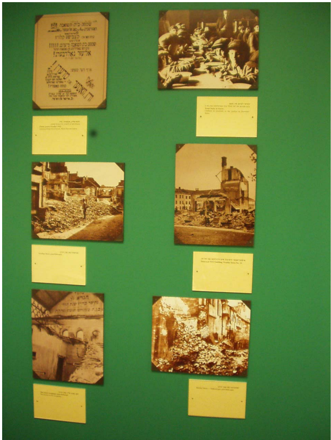
Segment „Holocaust“ – Ruinen des jüdischen Viertels nach der Befreiung 1944