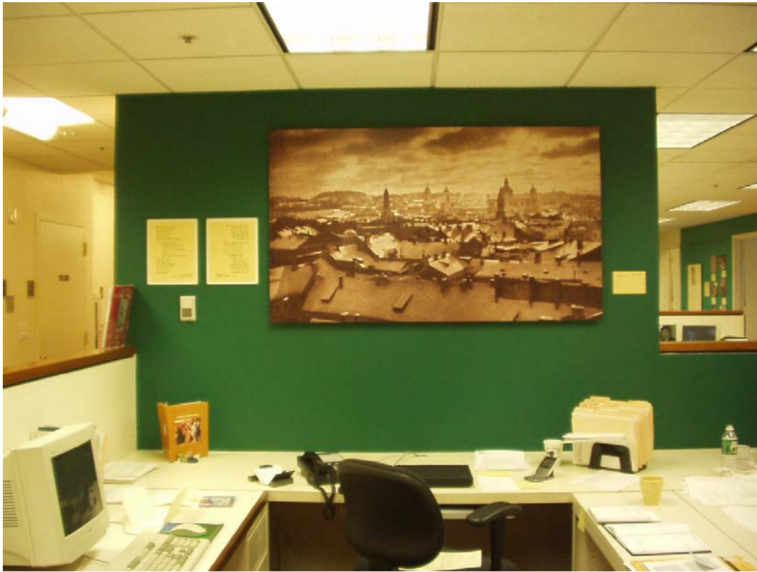
Zentrale Wand – das Stadtpanorama auf einer historischen Aufnahme vom Schloßberg auf die Altstadt von Wilna mitsamt dem jüdischen Viertel