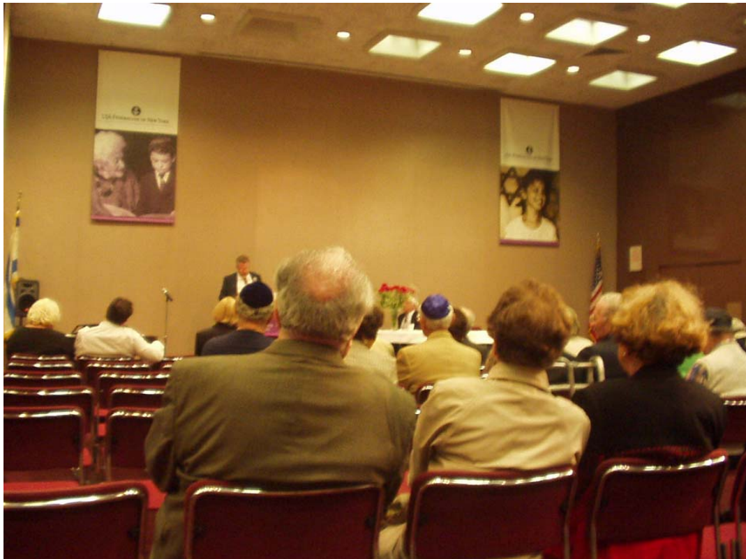
Vilner Haskore, 23.9.2002, UJA [United Jewish Appeal] Building, New York

Von Nusach Vilne 1947 erstmals organisiert, kamen ursprünglich ca. 600 Menschen, Überlebende und ihre Angehörigen. Die Veranstaltung findet in eigens angemieteten Räumlichkeiten säkularer jüdischer Organisationen in Manhattan statt und wird heute noch von ca. 80 Senioren besucht.