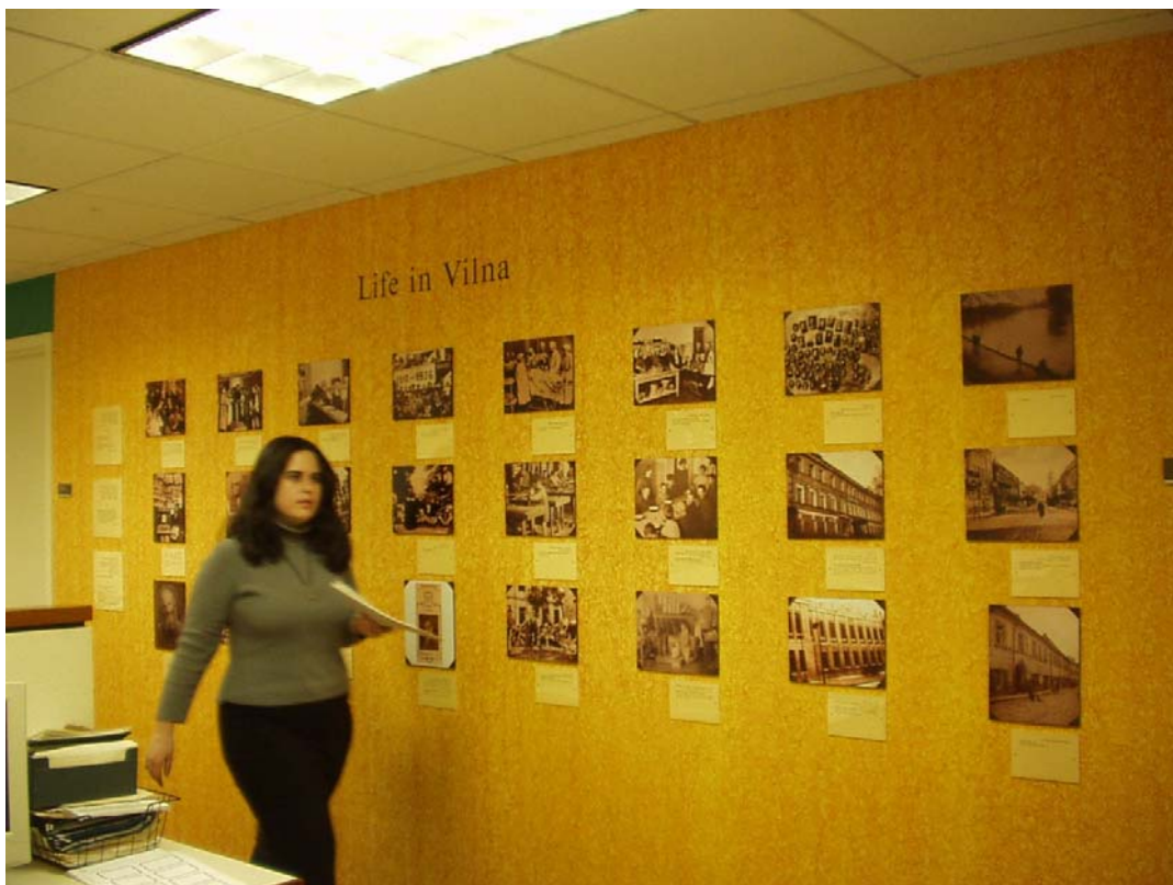
Segment „Life in Vilna“ – Persönlichkeiten und Institutionen aus dem kulturellen, politischen und religiösen Leben der jüdischen Gemeinde sowie den Wohlfahrtsorganisationen